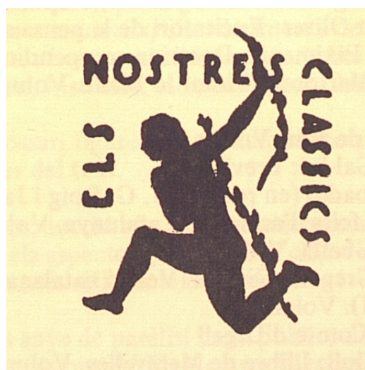
Segell de la col·lecció "Els nostres clàssics"